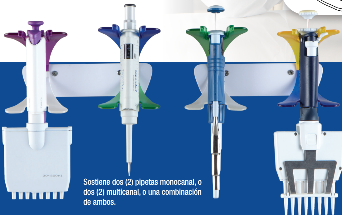
Sostiene dos (2) pipetas monocanal, o dos (2) multicanal, o una combinación de ambos.